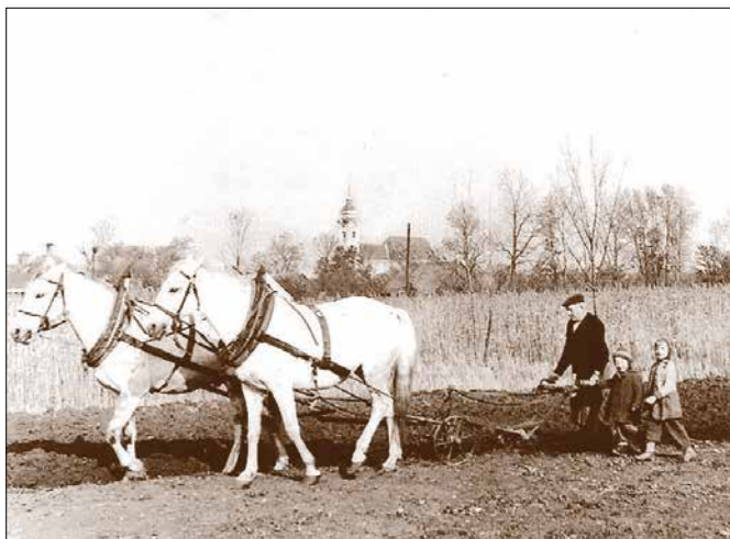
Fotografie a obrázky kostola na tejto dvojstrane pochádzajú od vás, našich čitateľov. Zaslali ste nám ich ešte na jar na základe výzvy na sociálnych sieťach. Ďakujeme vám za vašu snahu a ochotu. Ďalšie z nich uverejníme v jarnom čísle novín, v ktorom budeme pokračovať v tejto téme.